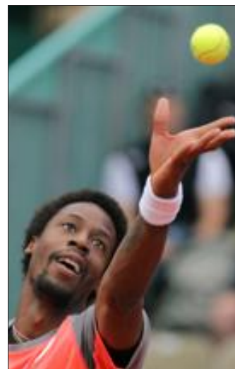
Gaël Monfils.

TENNIS. Après un double perdu au côté de Benoît Paire, Gaël Monfils a annoncé, hier, son forfait pour le tournoi de Nice où il devait entrer en lice aujourd'hui en simple. Pas remis totalement de sa blessure à la cheville droite, le Parisien a préféré ne prendre aucun risque à quelques jours seulement de Roland-Garros.